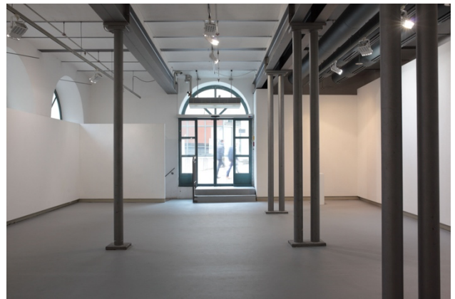
Bild links: Galerieräume in der Schranne vor der Bodensanierung, die dann mehrere Jahre später vorgenommen wurde.