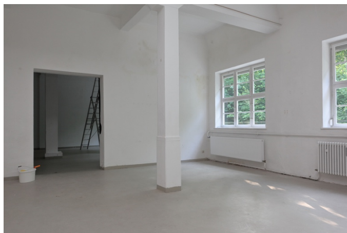
Bild: Zweite Galerie in der Brunngartenstraße (Planzeichnung erstellt von Heidi Lehwald)

Der Umzug in das neue Galeriegebäude erbrachte eine Vergrößerung der Ausstellungsfläche. Im neuen Gebäude konnten 2000 bereits fünf Ausstellungen, ausschließlich durch KVD-Mitglieder bestritten werden. Die Schlossausstellung stand unter dem Motto "Gestern – Heute – Berührungspunkt Kunst", eine Hommage an Künstler aus der Zeit der Künstlerkolonie.