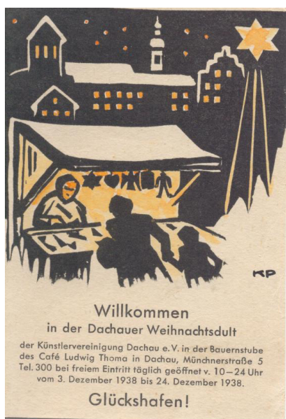
Auch im Jahr 1938 wird wieder zur Dachauer Weihnachtsdult eingeladen.